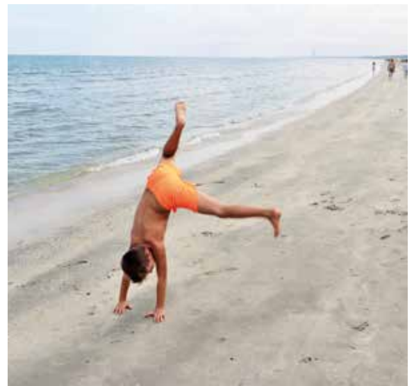
SI RINGRAZIANO I PICCOLI MODELLI CERVESI PER IL SERVIZIO FOTOGRAFICO DEL GRUPPO FOTOGRAFICO CERVESE

Die Strände von Cervia und seinen Nachbarorten, Milano Marittima, Pinarella, Tagliata, sind zweifellos „kinderfreundlich“. Davon sind die zweihundert italienischen Kinderärzte überzeugt, die alljährlich den familienfreundlichen Stränden in Italien die Auszeichnung namens „grüne Fahne“ verleihen. Dies erfolgt nach einer sorgfältigen Analyse und Auswahl. Cervia rühmt sich der grünen Fahne bereits seit langer Zeit und bewährt sich somit als der für Familien angemessenste Strandort Italiens. Die Voraussetzungen dafür sind ein weitläufiger Strand feinkörnigen Sandes, ausreichender Raum zum Spielen zwischen den Sonnenschirmen, niedriges und sicheres Meerwasser. Das ist der Grund, warum Cervia der ideale Ort für Kinder in jeder Altersstufe ist. Man kann einen soeben entpuppten Schmetterling in der Casa delle Farfalle in Milano Marittima pflegen oder aufregende Flüge zwischen den Pinienwipfeln auf den im Abenteuerpark Cervia Avventura verspannten Hochseilwegen erleben. Liebstes Kind, zweifle nicht daran: Während Deines Urlaubs wirst Du einen wahnsinnigen Spaß erleben. Um sich in den Wassersportarten, von den herkömmlichsten bis zu den coolsten Neuigkeiten, zu verbessern, labyrinthischen Wege im Pinienwald oder mit dem Erlernen, wie man das durch Verdunstung in der Sonne gewonnene Salz erntet.