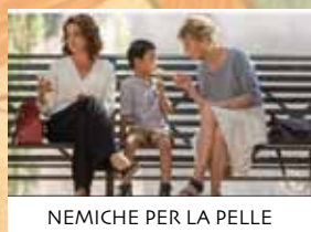
NEMICHE PER LA PELLE